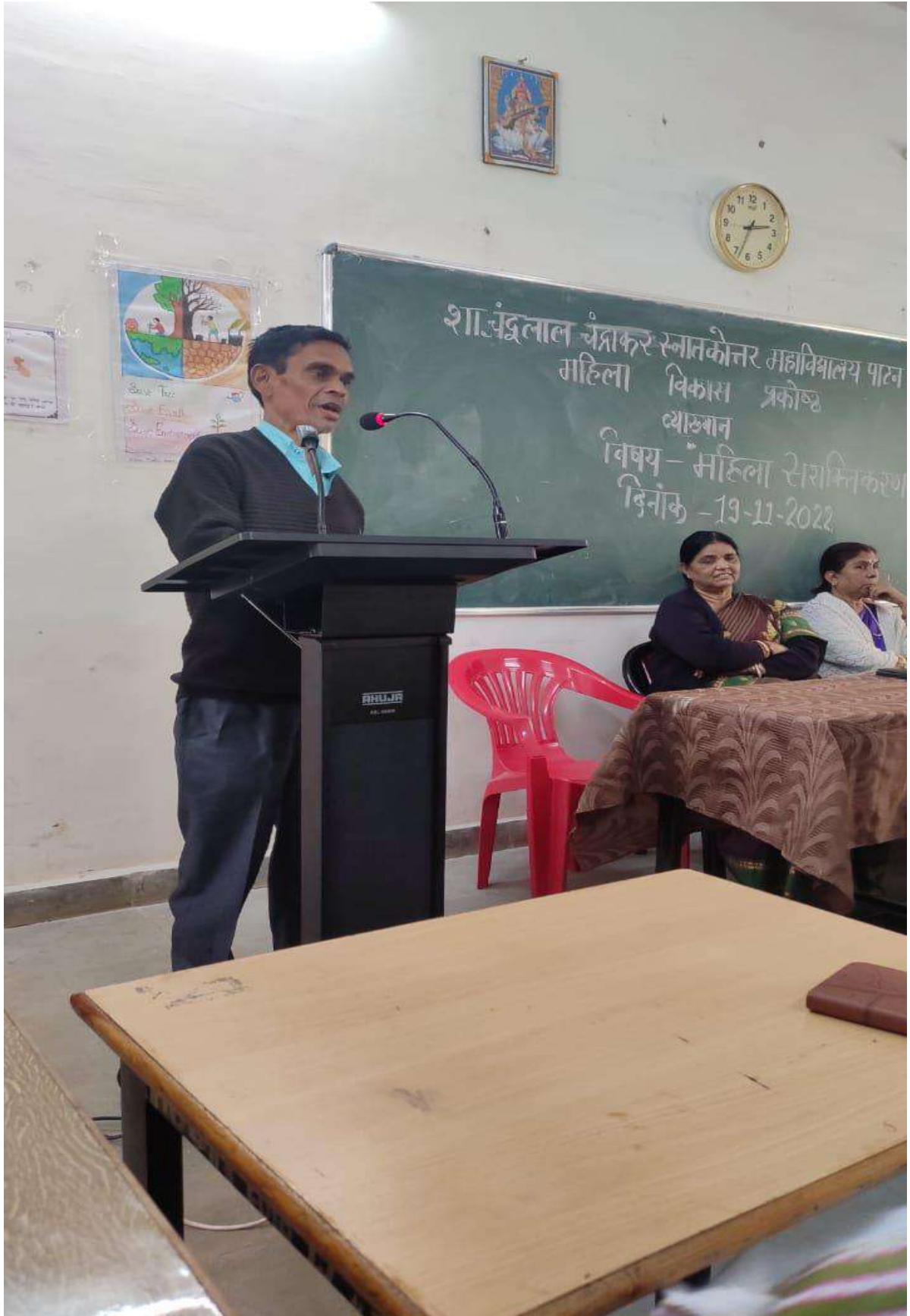
Women Empowerment Workshop 19.11.2022