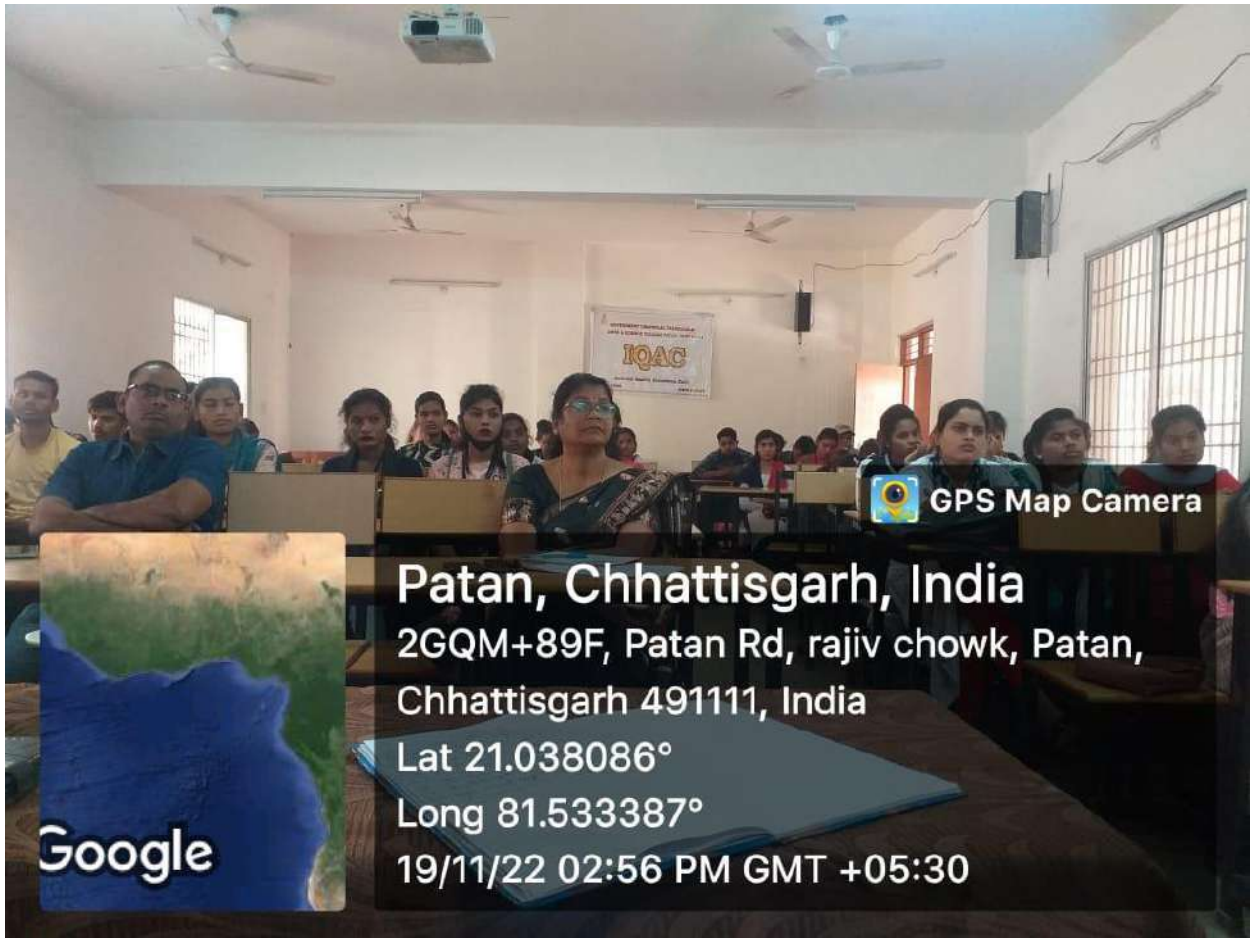
Women Empowerment Workshop 19.11.2022