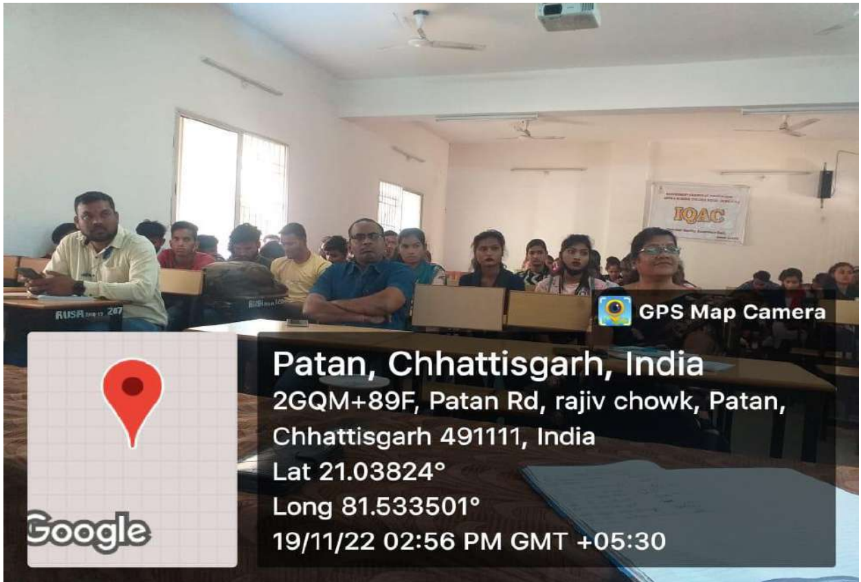
Women Empowerment Workshop 19.11.2022