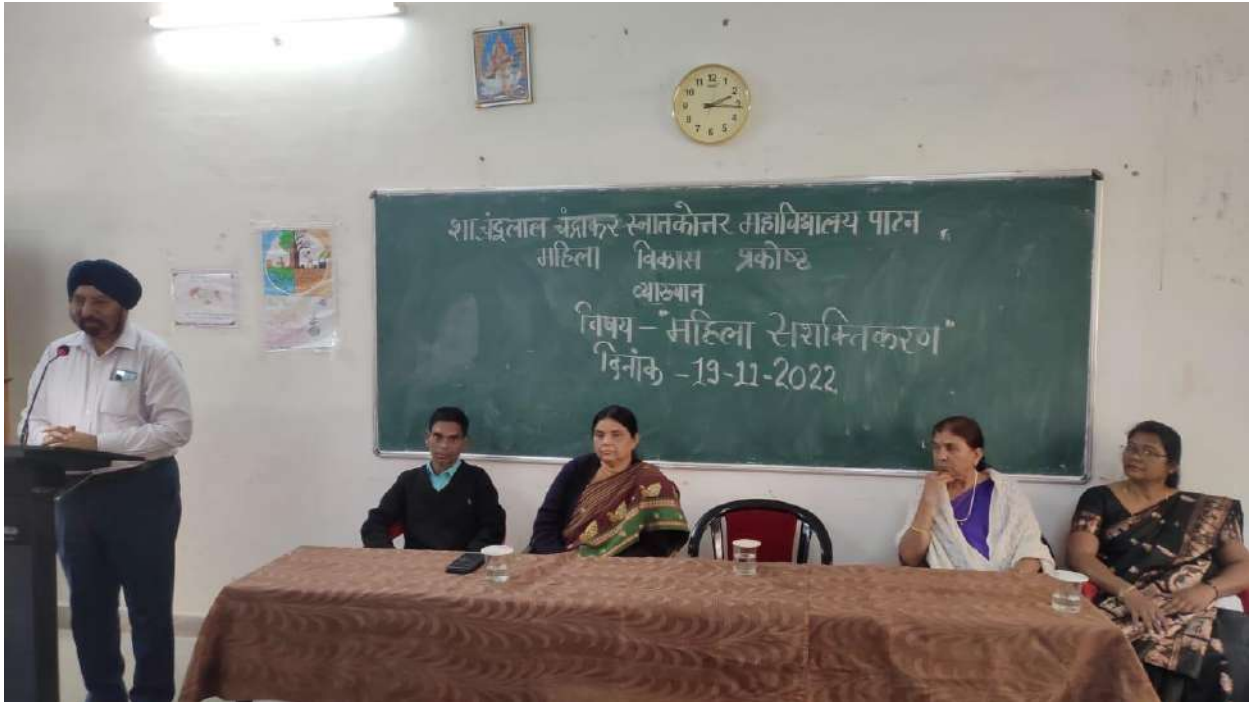
Women Empowerment Workshop 19.11.2022