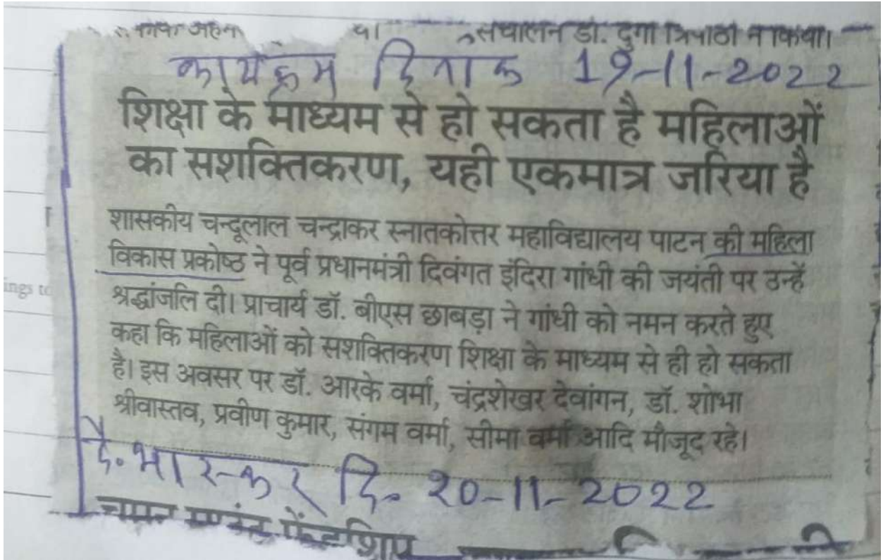
Women Empowerment Workshop 19.11.2022